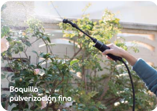
Boquilla pulverización fina